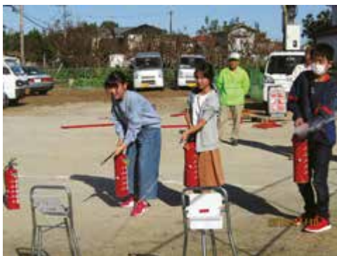
消火器が使えました！