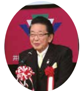
お祝いの言葉 杉浦市議会議員