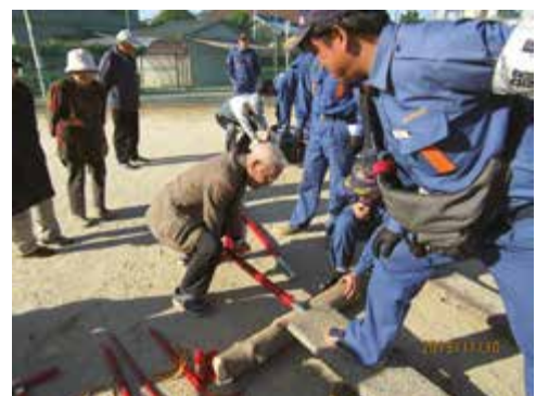
軽い力でも動くんだ！