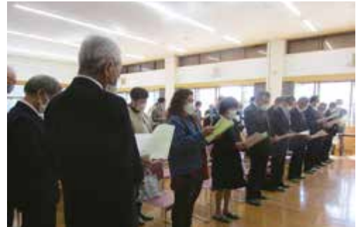
市民の誓い・唱和

3月19日、令和4年度天道自治区の通常総会を開催しました。新型コロナウイルス感染症予防の観点から、最低限の参加者で行い参加できない方には「書面表決書」を提出していただきました。総会は成立し、提案された全ての議案は承認されました。