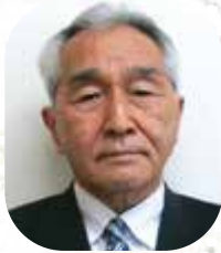
区長 杉浦 基之