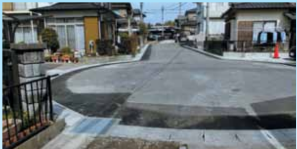
23組 青山邸前からの側溝の設置 (環境)