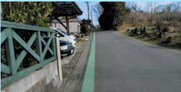
18組 森田邸前 グリーンベルト延長 (安全)