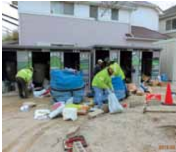
新聞・ダンボール…役員