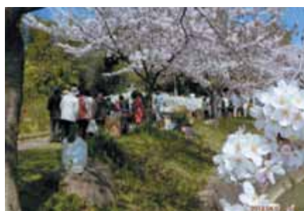
ユキヤナギも見事です