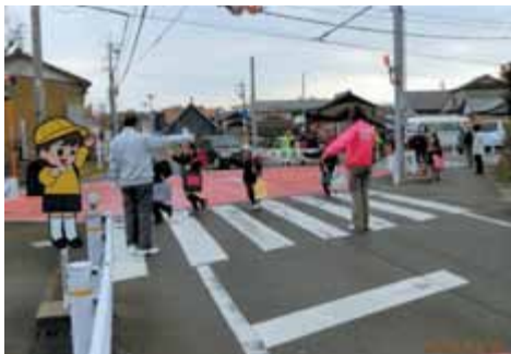
全国一斉春の交通安全の一環として、天道区内9か所で実施