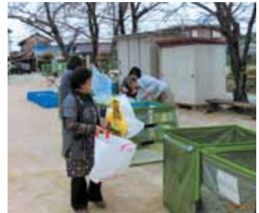
ビン・ペットボトル…組長