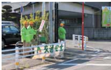
山畑交差点 交通量調査

各組長さん方のご協力をいただきまして、山畑交差点では交通量の調査、天道区内6か所で通勤・通学の立哨活動を実施しました。