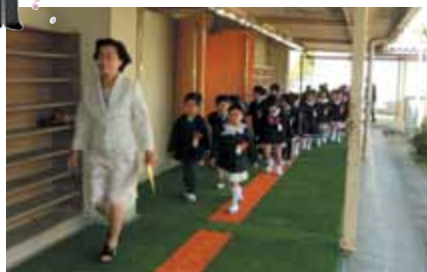
胸に「りぼん」をつけてさあ……元気よく入場です。