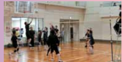
井郷地区競技大会にて