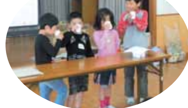
一人だけ違うものを飲んでいきます…