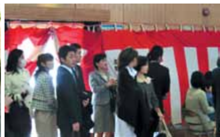
少し落ち着かない、心配顔のお父さん・お母さん。