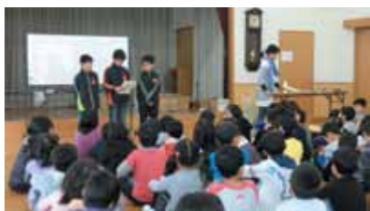
お兄さんの歓迎のあいさつ