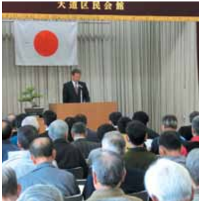
小栗区長のあいさつ