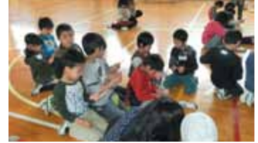
なかなかそろわないね