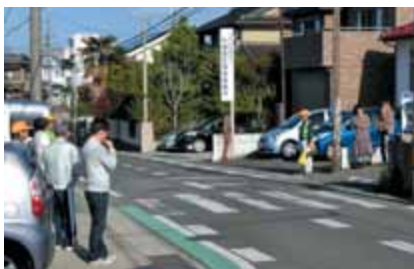
四季彩庵前 立哨活動