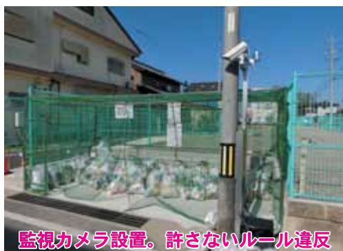
監視カメラ設置。許さないルール違反