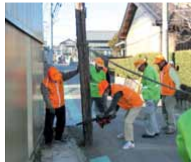
不要電柱の撤去作業