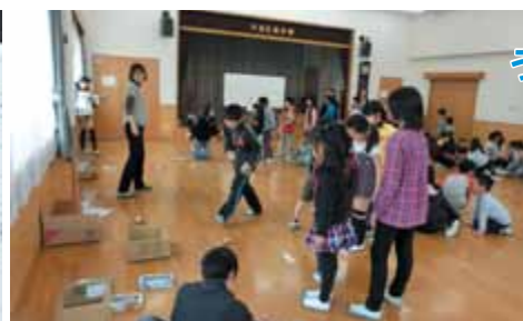
玉入れゲーム、さて何点?