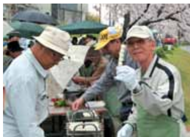
焼き立てダンゴ…うまいよー