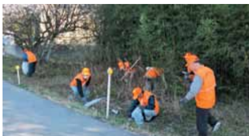
許しません！ゴミの不法投棄！