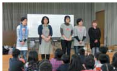
役員のみなさんです。