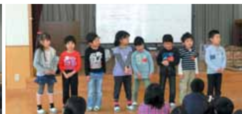
新会員(一年生)のみなさん。