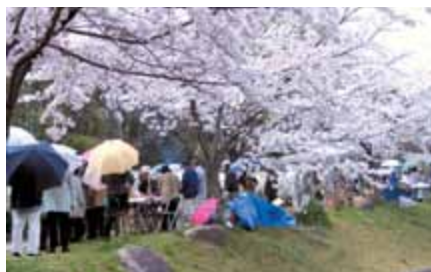
見事に咲きました、満開です

生憎の空模様で青空に花見とはいきませんでした、今年も「さくら」と「ダンゴ」を求め多くの人で賑わいました。