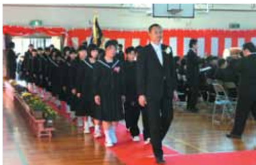
希望に胸を膨らませ、そして、少し不安の新入生150名の入場です。