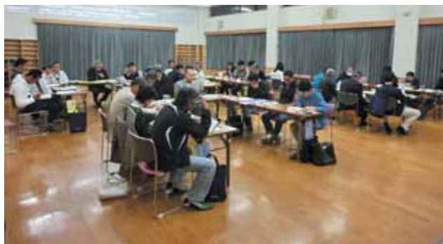
各組長の役割について