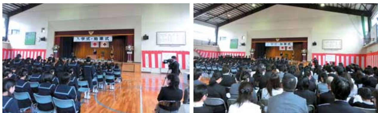
中学生の始まり 一人ひとり名前を呼ばれて起立します