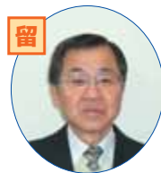
環境整備にご協力をお願いします