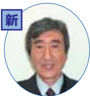
沢山の方に参加して頂ける行事内容にして行きます