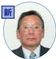
見てもらえる「天道だより」作りを頑張ります