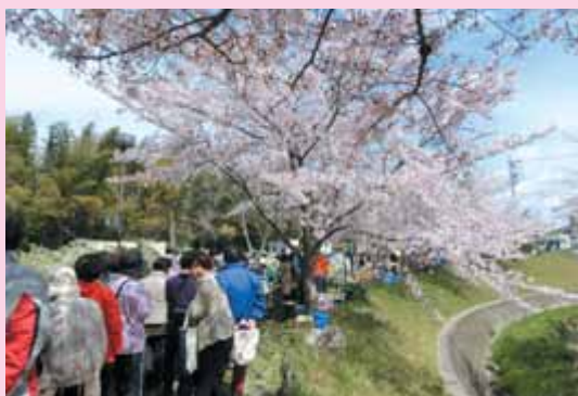
桜満開です！見事に咲きました！