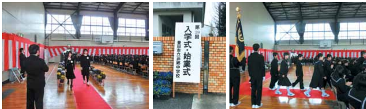
父兄や先輩たちの見守る中、新一年生ちょっと緊張しての入場です