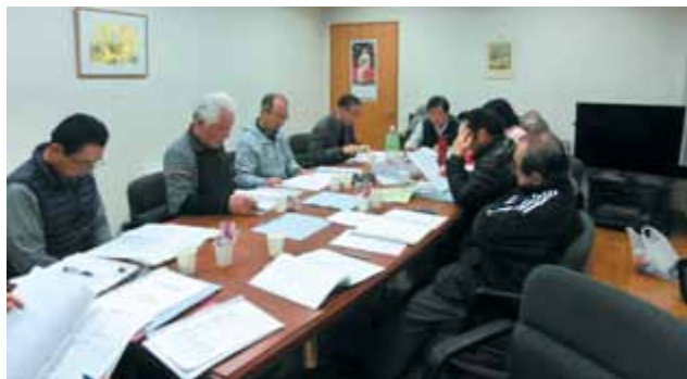
役員会議 いよいよ新年度の始まりです