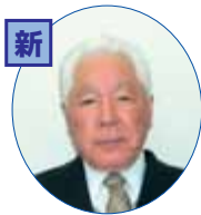
安心・安全な町づくりに頑張ります