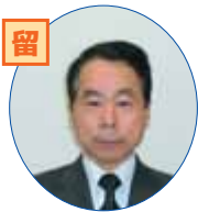
正確と節約をモットーとした会計を目指します