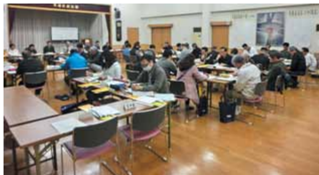
自治区からの協議及び報告事項等について