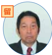
安心、安全な町づくりに努めます