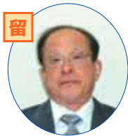
新しい気持ちで頑張ります