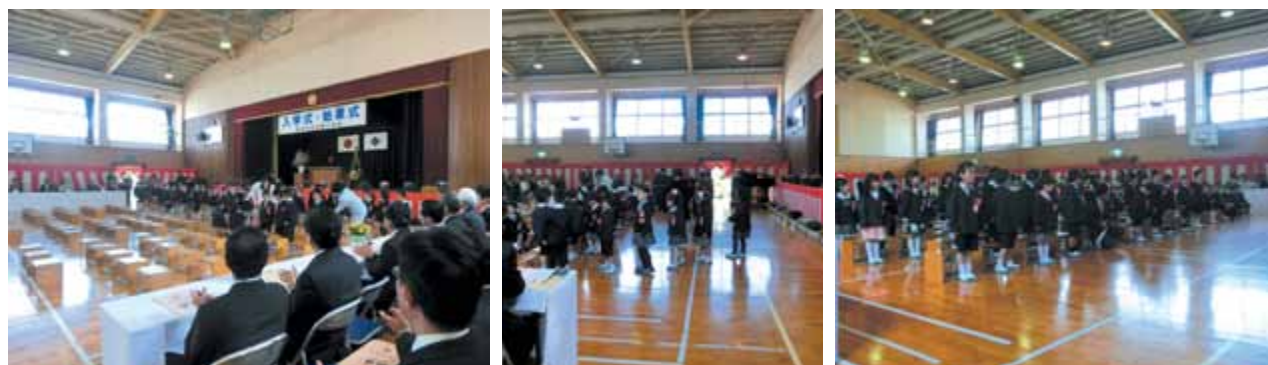
大きな拍手の中、入場です