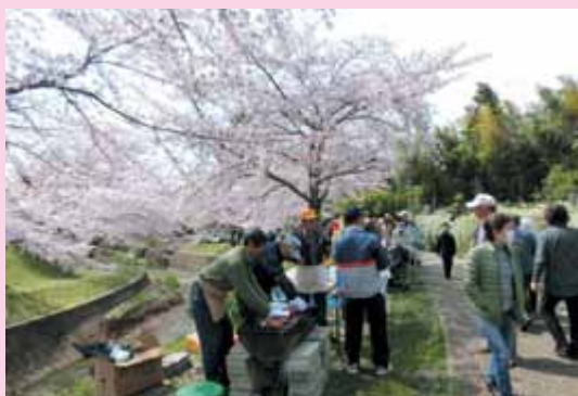
さあよってらっしゃい！ すぐに食べられるよー