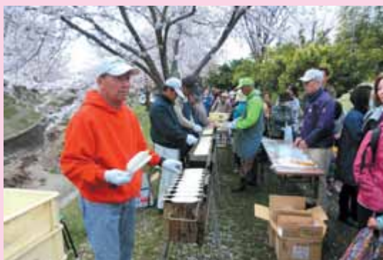
五平もち 沢山の人が並んでいます いつ焼けるのかな？