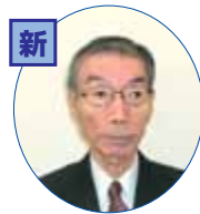
皆さんと共に、住み続けたい地域づくりに努めます