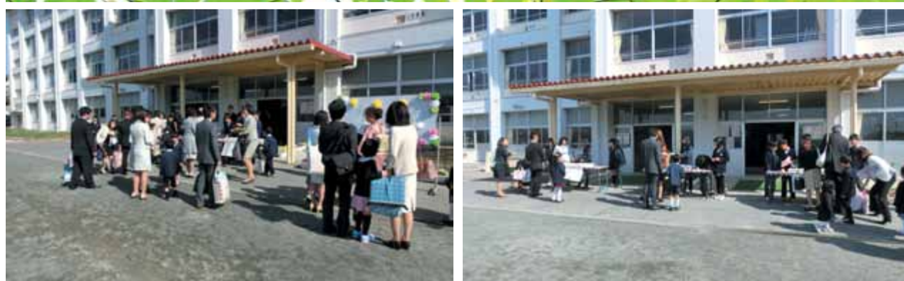
お父さん、お母さんと一緒に受付