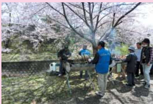
ああ～いいにおい！ アユと焼き鳥も焼けてますよ