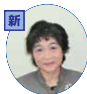
盆踊りへの参加、よろしくをお願いします