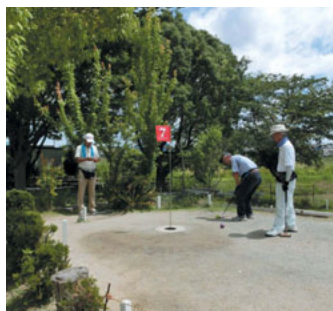
アレ?いくつか打ったっけ?