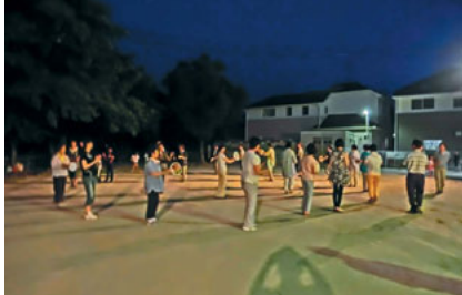
7月18日から始まった練習、新しい踊りはおぼえられるかな？

夏本番！ 夏と言えば盆踊り……！ 天道区の夜空に太鼓の音と、軽快な音楽が…… 7月14日(日)～8月1日(金) 総仕上げまで、みんな輪になり 踊った……踊った。