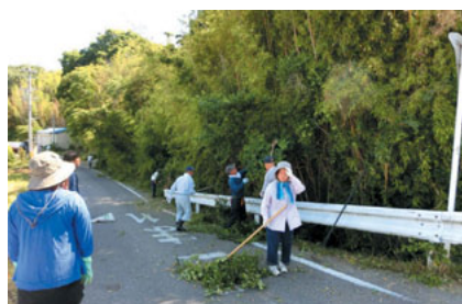
道路へはみ出た小枝の処理

春の環境美化活動が、区民の皆さんの参加により行われました。ちびっこ広場や道路沿いの草刈り、空き缶やゴミ拾い、側溝の清掃で町は見違えるほどきれいになりました。ご苦労様でした。