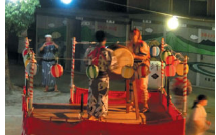
踊りも最高潮！ 太鼓連も調子出てきたよー