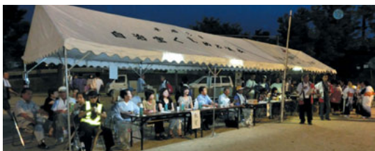
来賓のみなさんご苦労様です 先生も踊っては(?_?)