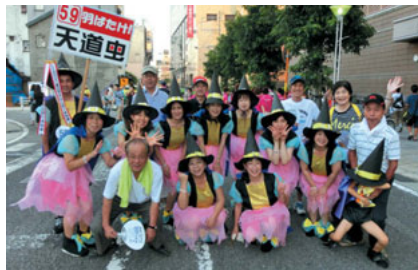
天道虫チーム及びスタッフ一同