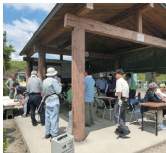
プレー後のひととき