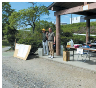
開会式 調区長のあいさつ

マレットゴルフ大会 6月8日(日) 四郷マレット場 天道区マレットゴルフ大会が開催されました。46名の参加を得て、優勝を目指して熱戦が繰り広げられました。好プレー、珍プレーで汗をふきふき頑張って、親睦を深めることが出来ました。