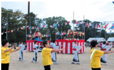
踊り連のみなさんです

太鼓連の打ち鳴らす太鼓のリズムに合わせて踊りの輪をつくりました。 関係団体が出店した夜店も大盛況でした。 夏祭りを支えた関係者の皆さんご苦労様でした。