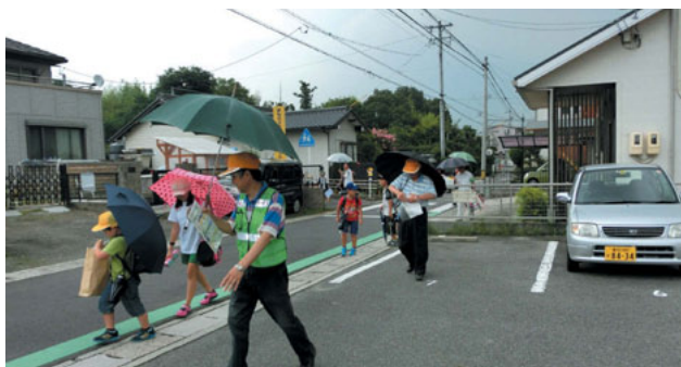
はみ出さないように前を見て歩きましょう