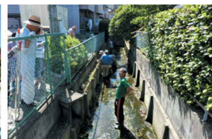
水路内の清掃(転ばないように注意)