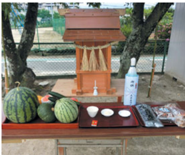
区民広場にお社をつくる

「ワッショイ」の元気な掛け声で七度参りが行われ、続いて花火があげられて無事終了しました。