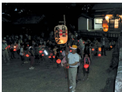
みんな提灯持って七度参りスタート