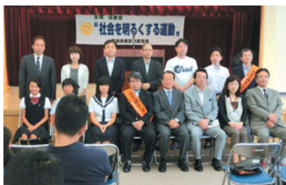
社会を明るくする運動で活躍されている皆さん

これらを入れるリュックサック (*荷物の重さは成人男性で15kg、女性で10kgが目安です)