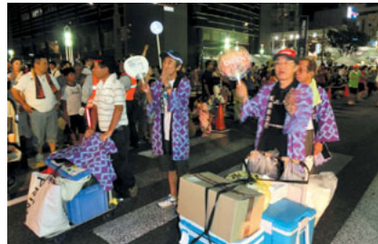
援助隊もガンバッテますよー