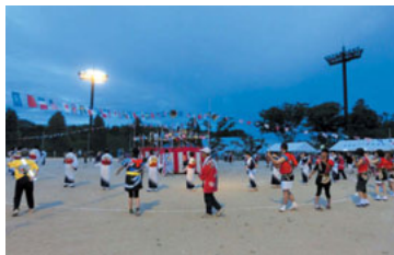
みなさん見事です