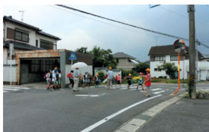
手をあげて横断歩道を渡りましょう