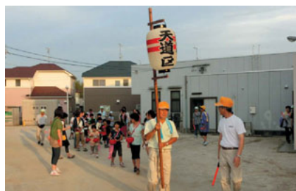
八柱神社へ さあ出発