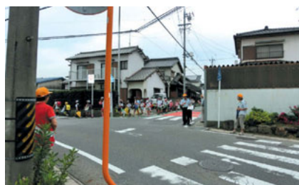
立哨……ご苦労さまです