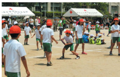
天道A子供会・青空子供会 合同運動会