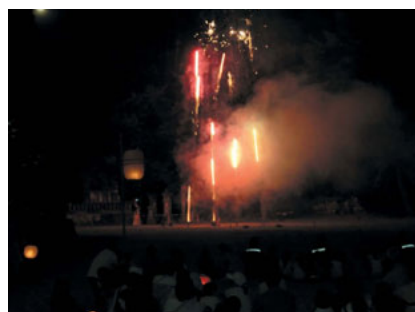
七度参り終了後の花火