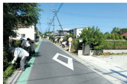
道路わきの雑草取り