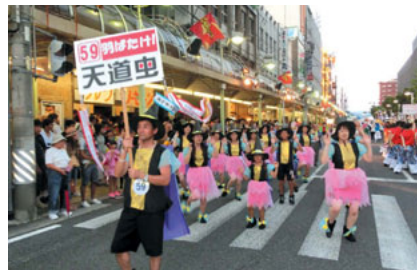
サー頑張って踊りましょう