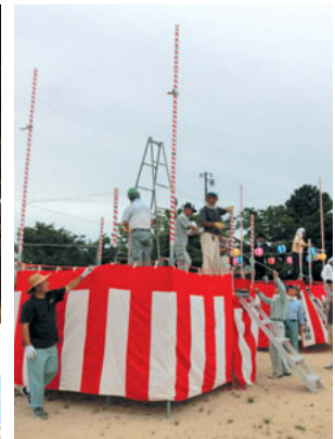
暑い中松茸会の皆さん 檣組ご苦労様です

太鼓連の打ち鳴らす太鼓のリズムに合わせて踊りの輪をつくりました。 関係団体が出店した夜店も大盛況でした。 夏祭りを支えた関係者の皆さんご苦労様でした。