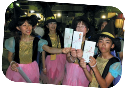
入勝賞品をもらったよー