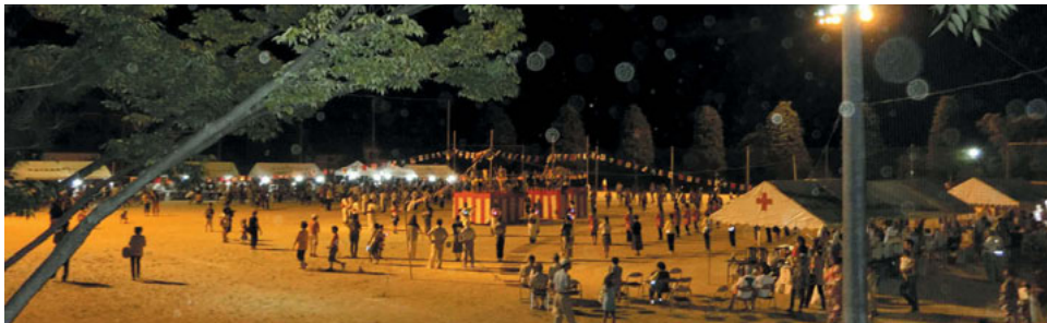
みんな一緒に踊りの輪・輪・輪！