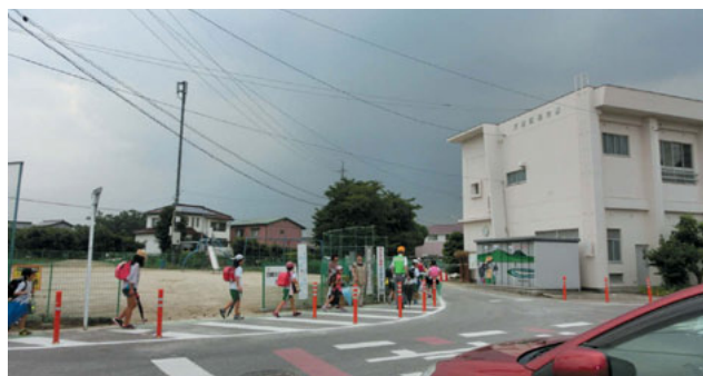
前の人について遅れないように