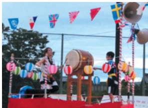
いい響き……太鼓連のバチさばき