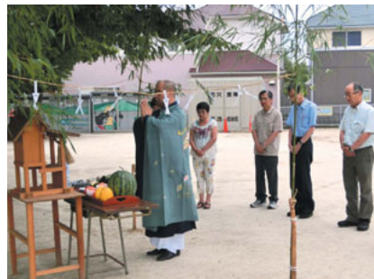
雲龍寺さん、役員にてお参り