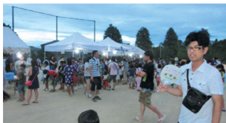
夜店也大盛況 人・人・人！