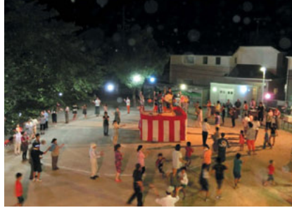
アー 炭坑節ならおどれるよー