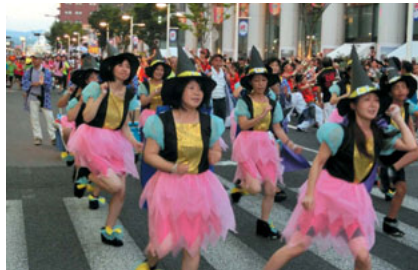
いいペースで調子出てきた