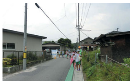
せまい道路は一列で