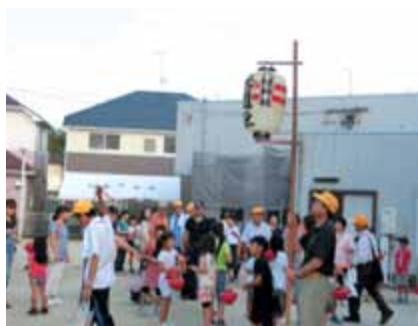
提灯を手にサー出発