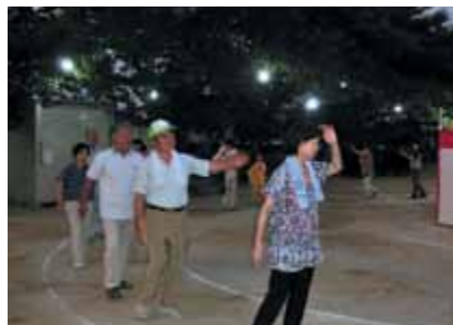
「炭鉱節」なららせてください。