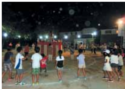
「おいでん踊り」なららせてよ!