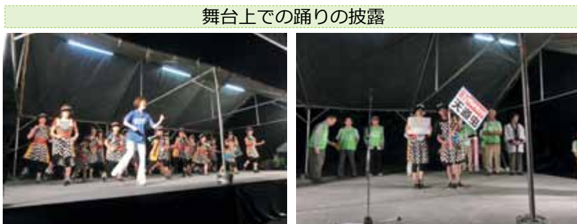
舞台上での踊りの披露