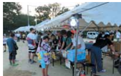
太鼓連・棒の手・松茸会 子ども会・ジュニアクラブの皆さん ありがとうございました。