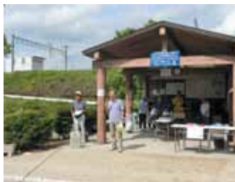
調区長・杉浦市会議員のあいさつ