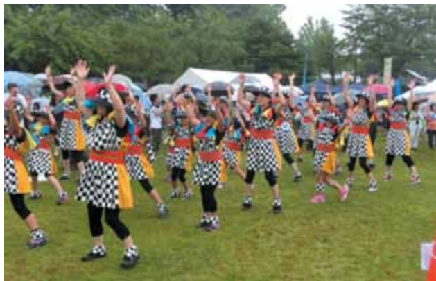
雨の中でも気合が入ってます。