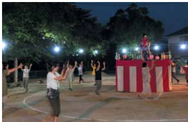
太鼓連もがんばっています