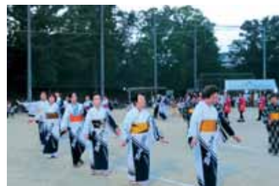
そろいの浴衣で見事です