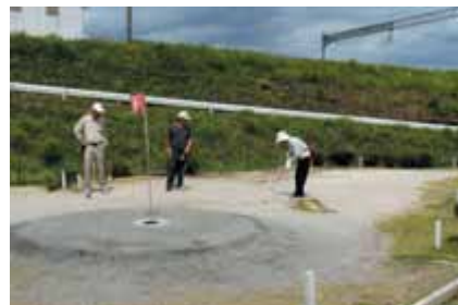
なんとか山を上げれ!