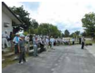
大勢の参加者の皆さん