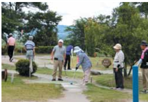
狙いを定めて エーイ