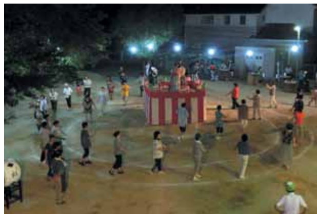
皆さん輪に入って踊りましょう