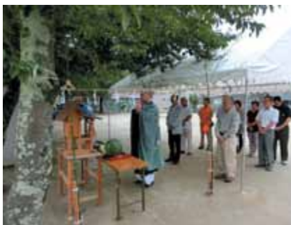
雲龍寺さん・区役員の皆さんでのお参り