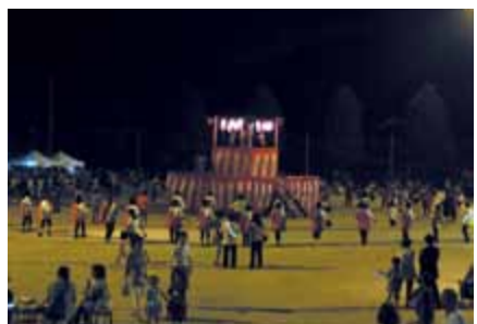
たくさんの人で大きな輪