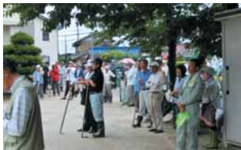
調区長・杉浦市会議員のあいさつ