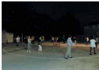
まずは踊りの練習から