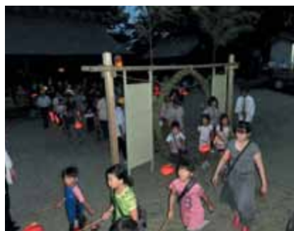
茅の輪をくぐり厄落とし