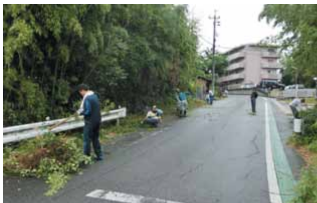
道路にはみ出した枝の伐採・草刈り・側溝内の土砂出しなど大変な作業でした。