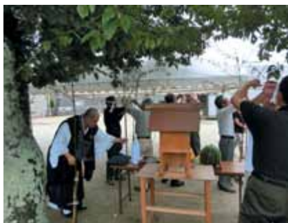
天王祭りに備えて、お社造り