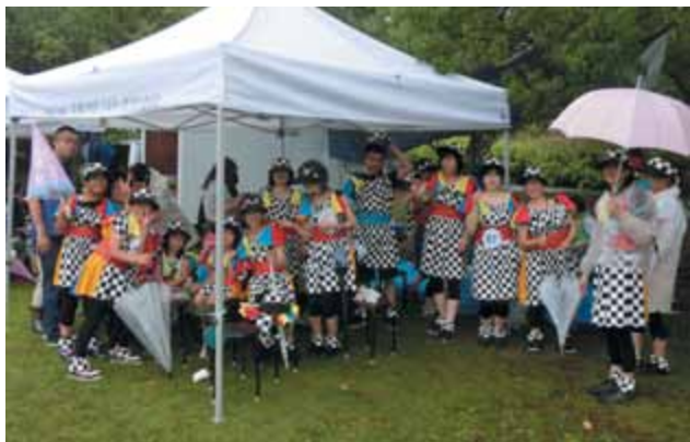
準備中の「天道虫」の皆さん