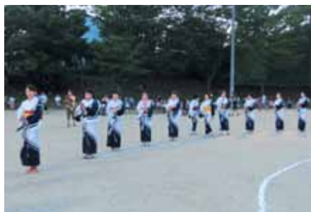
天道踊り連の皆さん