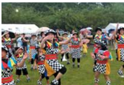
小さな子も大人と一緒に がんばってます。