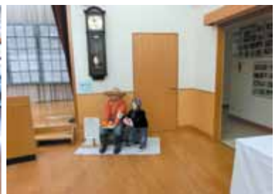
例年のように素晴らしい作品が沢山展示されました