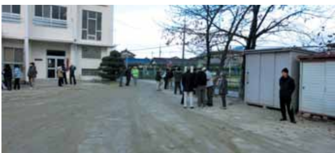
自主避難場所への集合状況