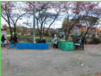
月例 資源ゴミの日

末は、役員改選の時です。行事の多さや、職務の大変さを考えると、役員を引き受ける人がなかなかいません。歴代の区長経験者が、選考に非常に苦労しています。各組の組長人選については、持ち回りになっており、何の問題もなく引き受けてもらっています。そこで提案ですが、四十ある組の中で、世帯数を考慮し片寄らないように、二年から三年のサイクルで、役員を引き受けてもらうことにしたらどうでしょう。多くの方々の考えで行事を企画、実践してもらうことにより、良き活動が計れると思います。相談役会及び役員経験者で検討し、役員選考の仕組み作りをお願いしたい。 特にこの地域は、高齢化が一段と進んで来ており、防災訓練も始まり、各世帯間の絆が大切と言われております。是非とも、よろしくお願いします。 最後に、退任しても地域の行事等には、積極的に参加して、協力していく所存です。二年間色々と勉強させてもらい有意義に過ごせました。誠にありがとうございました。