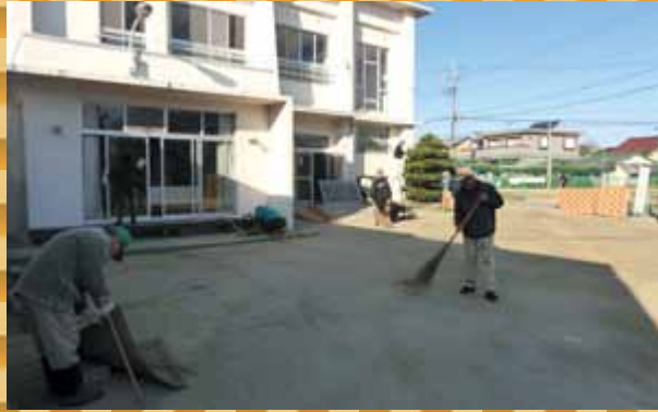
幸友クラブの皆さん