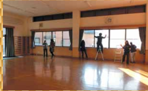
ジュニアクラブ、子供会役員の皆さん