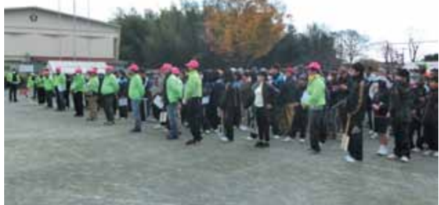
組長さんによる安否確認