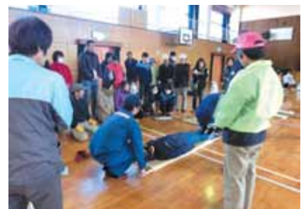
避難所での訓練体験 (応急手当・簡易トイレ・簡易タンカ) など