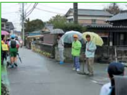
四郷小・見守り活動