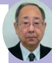
区長 調 康雄