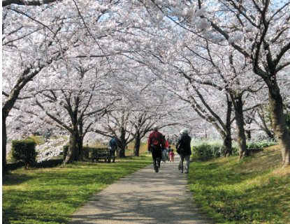
水無川のソメイヨシノ