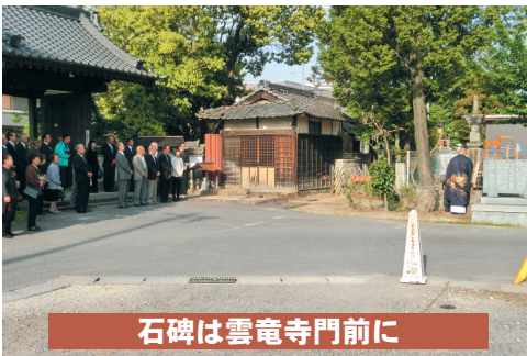
石碑は雲竜寺門前に

宝暦二年、重税に苦しむ 挙母藩の農民達の代表者が 江戸屋敷の藩主に訴え税貢 租軽減を実現した。しかし その為代表者6名が打ち首 となった。その業績を称え 供養が行われています。