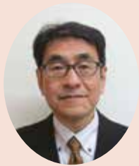
副 区 長 清原 郁夫